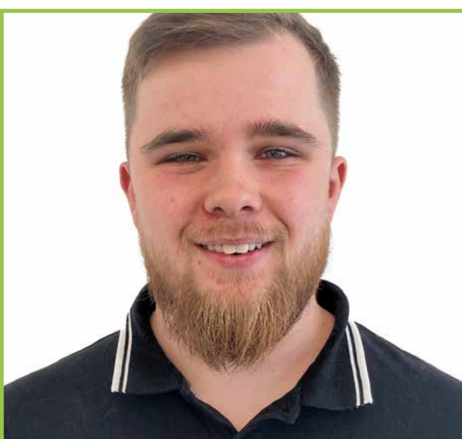
Jan-Niklas Theis Zum Märchenland 9 40235 Düsseldorf